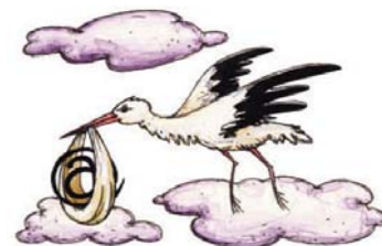
Figur 1 - fra pjecen "mindre bøvl - mere frihed"

Når nye borgere ser dagens lys, skal forældrene som noget af det første foretage en fødselsanmeldelse. I dag skal dette ske senest to hverdage efter fødslen enten ved at møde personligt op på kirkekontoret eller ved at sende anmeldelsen per brev. Blandt de nye initiativer er, at det skal være muligt at foretage fødselsanmeldelse via Internettet ved hjælp af digital signatur, så nybagte forældre fremover i ro og mag kan foretage anmeldelsen fra hjemmecomputeren.