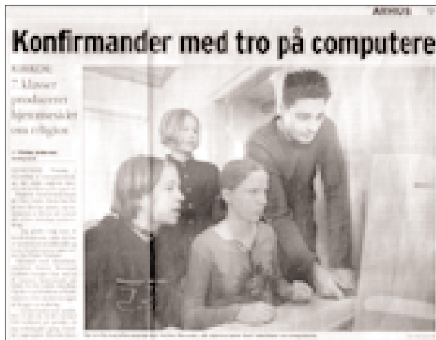
IT i konfirmandundervisningen omtalt i Århus Stiftstidende.

IT-strategien forholder sig derfor til, hvordan man fra Kirkeministeriets og folkekirken side kan organisere udviklingen af de elektroniske tjenester, som skal tilbydes folkekirken.